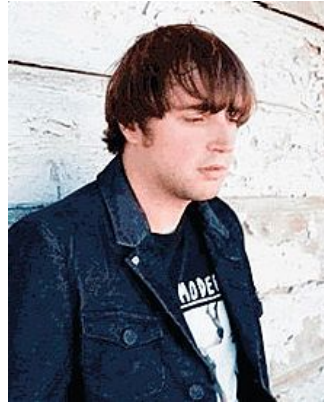
Il cantante De Niro

■ Talentuoso e visionario, The Niro trova dal vivo la sua dimensione ideale. Per lui, da fine ottobre, una serie di concerti che toccheranno diverse regioni d'Italia. Una buona occasione per dare veste live all'ultimo lavoro in studio,