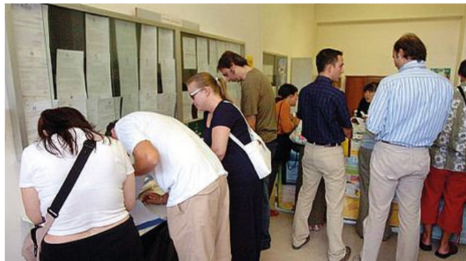
Docenti consultano le liste all'ufficio provinciale della scuola

La Provincia invita i docenti precari modenesi a prepararsi a redigere l'usuale domanda di disoccupazione Aspi ma per moltissimi potrebbe essere davvero l'ultima volta. Grazie al piano governativo di assunzione in ruolo di più di 100 mila docenti precari (saranno migliaia nella provincia di Modena) approvato dalla Camera nell'ambito della Riforma della Buona scuola, per molti docenti modenesi potrebbe essere cessato l'incubo. Si attende il sì del Senato ma poi è fatta. Si tratta dunque di coprire con l'assegno Aspi l'imminente periodo estivo durante il quale migliaia di precari della scuola non ricevono lo stipendio. Per questo l'amministrazione provinciale ha inviato a tutti i dirigenti scolastici l'invito formale a informare i prof con contratto al 30 giugno dell'esistenza di una procedura snella che consente agli interessati di evitare le lungaggini e le file previste per il 1 luglio. E' possibile infatti rendere la dichiarazione di im-