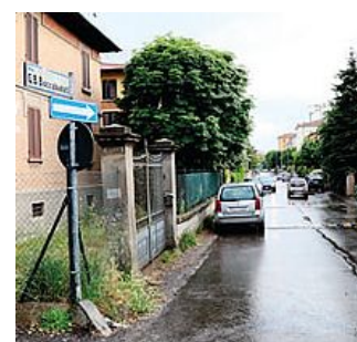
Una veduta di via Boccadati

IN UN TRATTO Via Boccadati cambia la viabilità sarà a senso unico