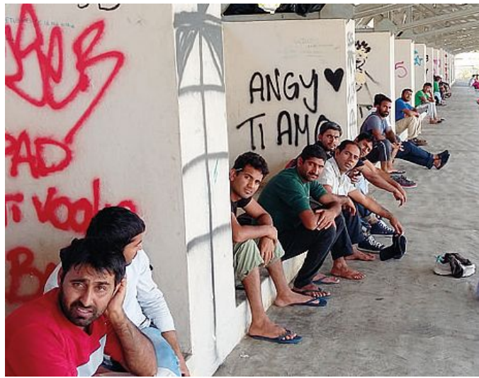
Alcuni profughi pakistani che alloggiano sulle tribune del Novi Sad

Si tratta di un bando pubblico, sulla base del criterio dell'offerta economicamente più vantaggiosa (nella valutazione il 70% si basa sulla qualità tecnica e organizzativa, il 30% sulla valutazione economica), che coinvolgerà più operatori economici attivi nella provincia di Mode-