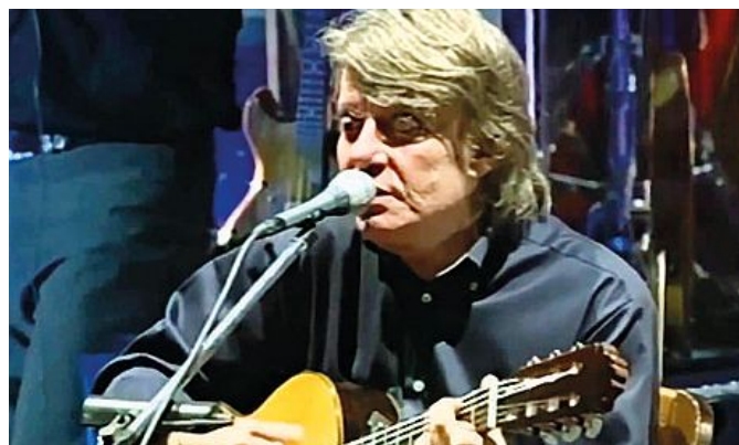
Fabrizio De André