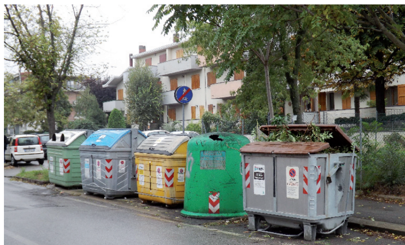
I raccoglitori di via Montanara, con l'organico straripante e la campana vetro rotta