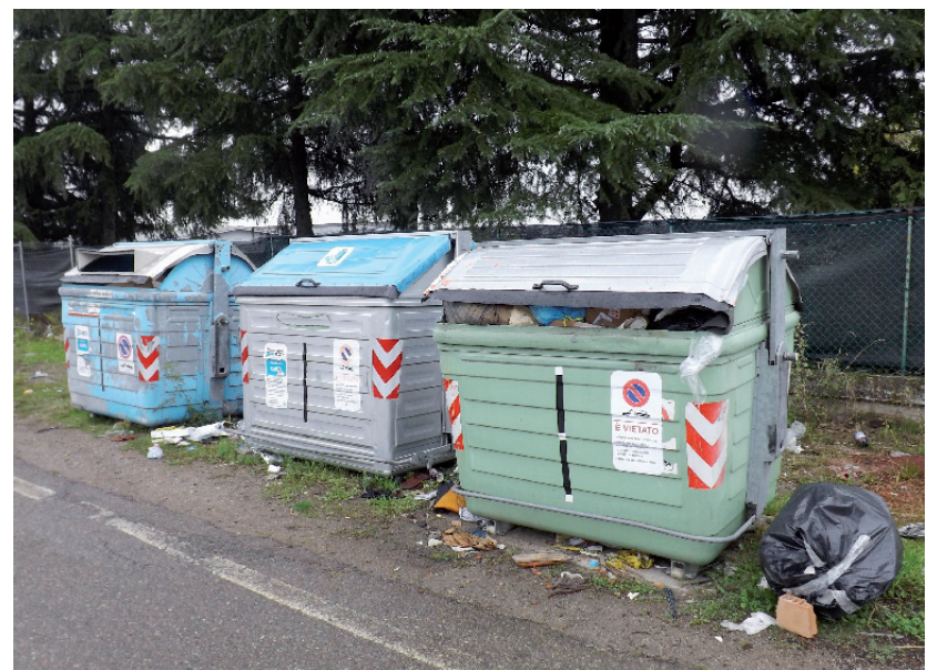
L'incredibile scenario di via Paraviana (sopra). Ma lascia desiderare anche via per Sassuolo